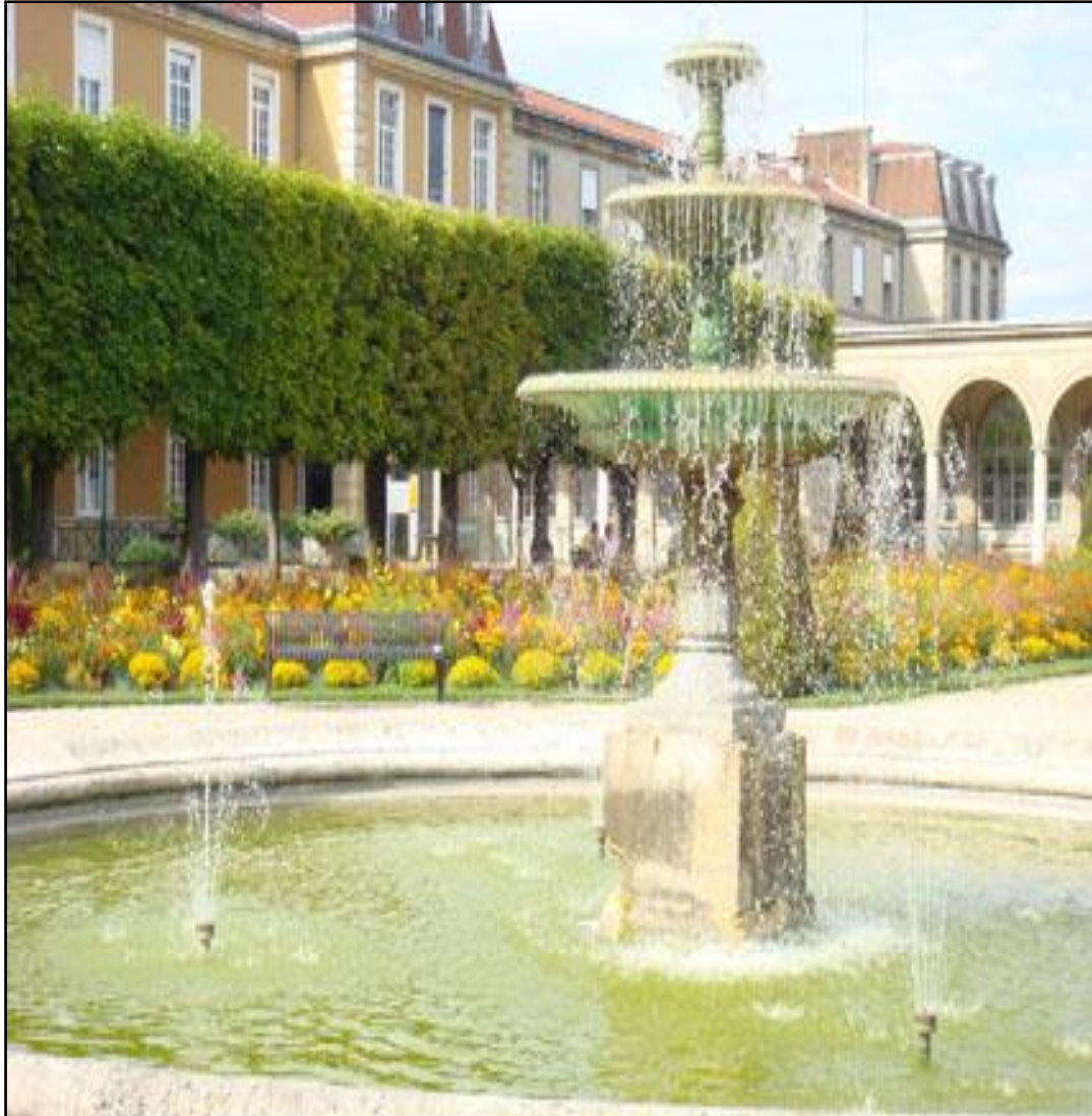
Hôpital Charles Foix